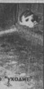
Бетонный пол постепенно "уходит" из-под ног.

дить изменения в их подъезде. В 2002 году провело трубу с горячей водой, и эта вода целые сутки текла в подъезд, просачиваясь через пол в подвал. Именно горячая