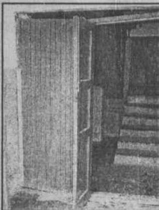
Дверная коробка скоро станет "ромбовидной".