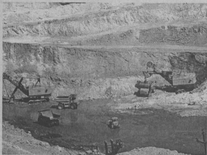
Ширится карьер «Юбилейный».

Сергей МАНЗУРОВ, «УГМК-Холдинг. Вести». Фото автора.