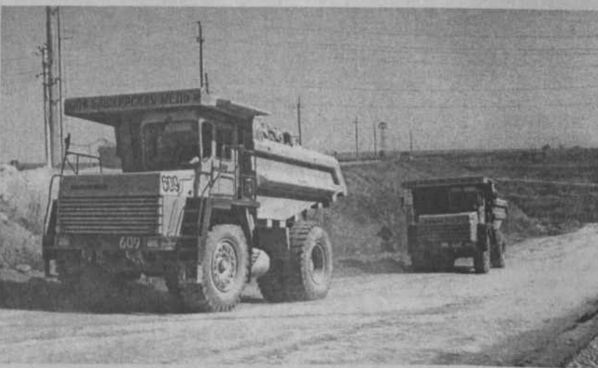
Башкирская медь идет на-гора.

Карьер и обогатительная фабрика относятся к первому этапу освоения месторождения. Его основные зап-