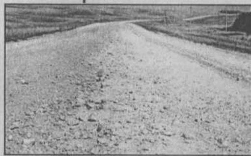
Такие булыжники на автодороге можно увидеть на трассе Уфимск—Новопетровское.