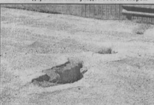
Не дай бог угодить колесом в эту яму на мосту у д. Новопетровское.