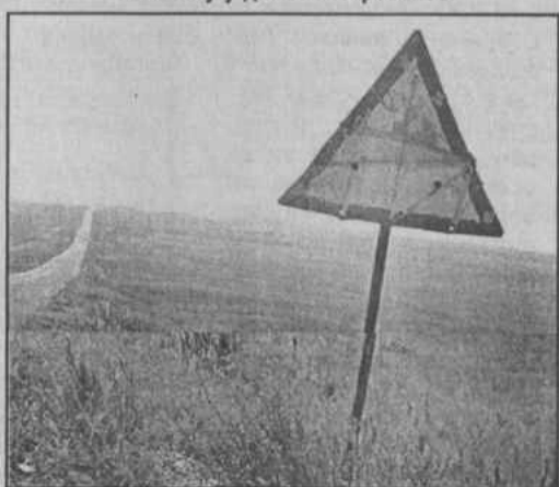
Угадайте: что означает этот дорожный знак?