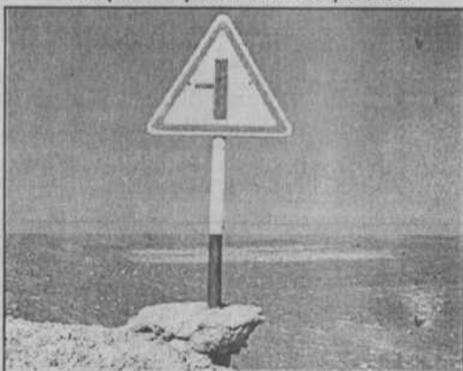
Этот дорожный знак упадет совсем скоро...