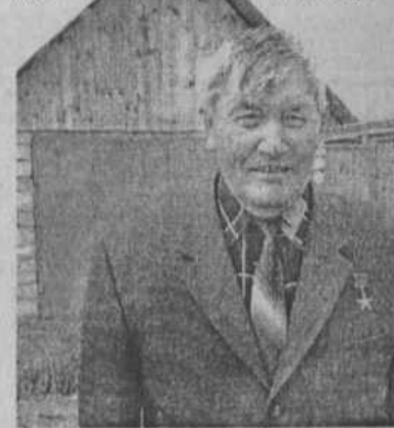
«Образцовый дом», как хозяин лучшей усадьбы села.