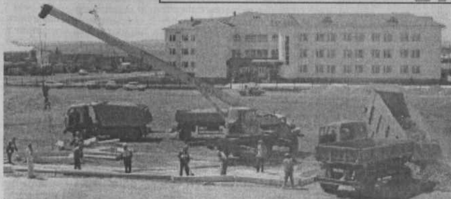
На снимках: предполагаемый план зоны отдыха (крестиками обозначены детская площадка, сцена, кафе); скоро у площади будет новое лицо.