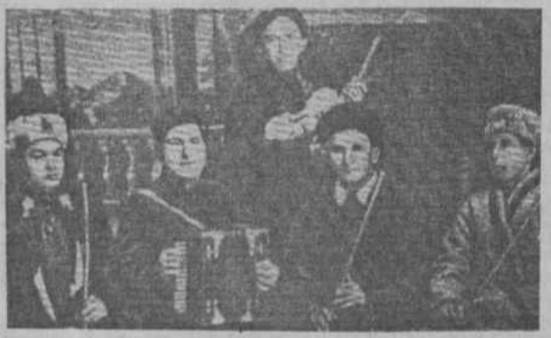
1927 год. Первый народный инструментальный ансамбль при Башкирском академическом драмтеатре.