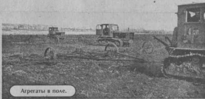
Агрегаты в поле.