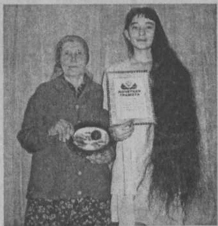
участницам предстояло отвечать на вопросы веду-

А на сцене уже идет демонстрация причесок. И как только не называли их «Золушка», «Русалочка», «Фонтан цветов», «Жади», «Фея», «Водопад» и другие. Больше всех