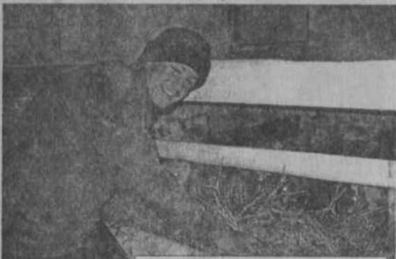
Молодой животновод Максим Шлакайтис

В одно время на ферме уход за молодым обеспечивался не на должном уровне - телята часто болели. Но вот полтора месяца назад этот от-