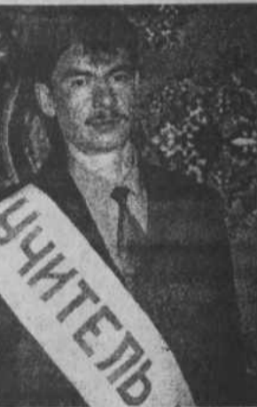
Обладатель ГРАН-ПРИ конкурса «Учитель года - 2004»