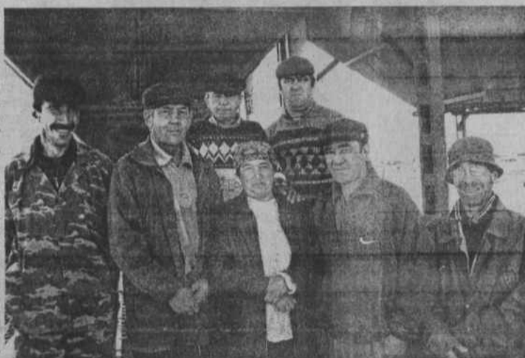
На снимке: рабочие тока Центрального отделения.

Надежда и уверенность не покидают ургазинцев, а значит, удачи и победы у них еще впереди.