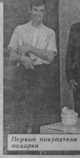
Первые покупатели получили подарки

яры что он поведет: До сегодняшнего времени мы работали на протяжении последних 5 лет в здании универмага. Народ Хайбуллинского района нас знает. А с этого дня мы начинаем работать на более высоком уровне. Обеспечить качественный сервис торгового обслуживания наших покупателей — вот наша основная задача. Мы предоставляем жителям Акъяра и всего района большой ассортимент товаров, чтобы дать возможность каждому выбрать нужное по душе и по цене. Я думаю — это немаловажный фактор, так как люди на селе имеют право на такой же широкий выбор качественной техники, как и городской житель. В отличие от известных торговых сетей, мы работаем на месте. У нас нет вышестоящих руководителей, поэтому с каждым клиентом мы работаем индивидуально. В связи с предоставленной возможностью хочу поздравить всех хайбуллинцев с 75-летием района и пожелать им здоровья, благополучия и мира. Будем рады видеть всех в нашем магази-