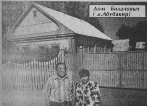
Дом Билаловых (д.Абубакир)

Хотя еще и есть над чем поработать, но продвижение в деле благоустройства наших населенных пунктов уже заметно. Что ж, пожелаем удачи тем, кому небезразлично место, в котором проживает он сам и его семья, а тем,