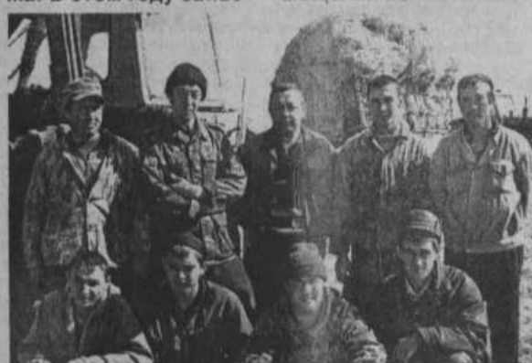
Группа полеводов Абубакировской бригады на заготовке соломы.

Кстати, в кооперативе кормозаготовка прошла также организованно. Селяне сумели обеспечить хозяйство кормами в достатке. Завершили закладку силоса и сенажа. В этом году запас-