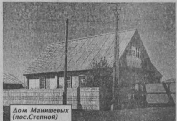
Дом Манишевых (пос.Степной)

тельную работу среди односельчан, и сами личным примером в хорошем состоянии содержат свои дома. Особо