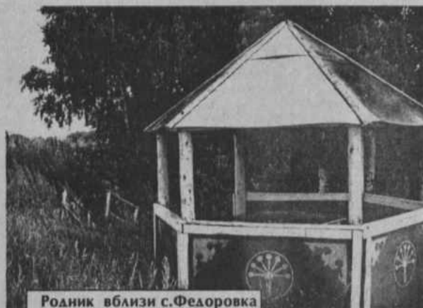
Родник вблизи с.Федоровка

Приятно были удивлены, когда обнаружили недалеко за с. Федоровка кра-