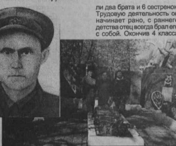
Дочери у могилы отца с. Уборки, 2005 год