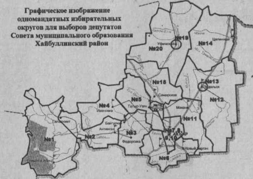
Схема избирательных округов по выборам депутатов Совета муниципального образования Хайбуллинский район

Приложение 1 к решению ТИК Хайбуллинского района №2 от 11 августа 2005 г.