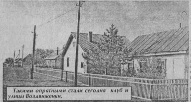
Такими опрятными стали сегодня клуб и улицы Воздвиженки.

В настоящее время в деревне в 89 дворах проживают 350 человек 6 национальностей.