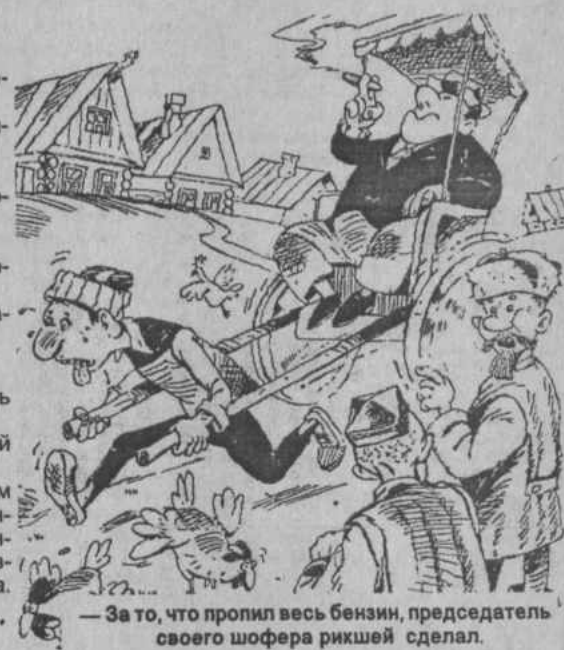
— За то, что пропил весь бензин, председатель своего шофера рикшей сделал.