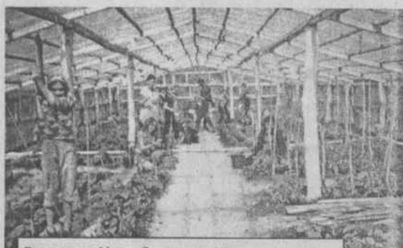
В теплице Ново-Зирганской средней школы.

и их здоровье даст положительные результаты. Стартовала Трудовая четверть. Пришкольный участок Уфимской средней школы занимает площадь 0,5 га. Имеется теплица в 300 кв.м. Здесь выращиваем лук, помидоры, огурцы, капусту, морковь, свеклу, кабачки, тыкву. Кроме этого здесь растут цветы. В теплицу высадили перец, помидоры, огурцы, дыню. С 1 июня по 9 июня 44 учащихся 5-8 классов пройдут практику, они занимаются посадкой, поливом, прополкой, рыхлением, подготовкой лунок для высадки капусты и помидоров. Всего должны обработать 216 учащихся в течение лета. М.Гумерова, директор школы.