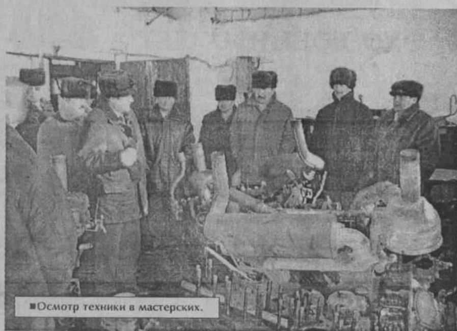
■ Осмотр техники в мастерских.

МУСП "Степной". Здесь не только созданы прочный запас кормов, но и хорошие условия для содержания