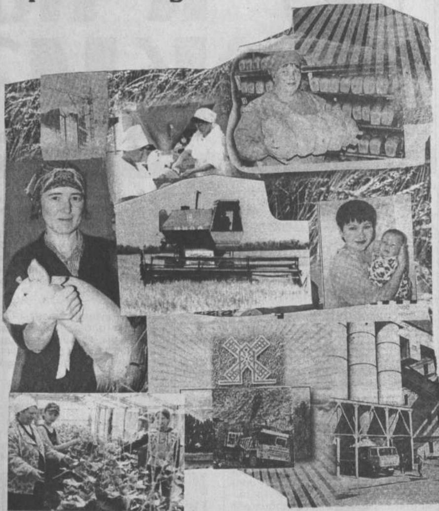
ПОГОЛОВЬЕ СКОТА ПО СОСТОЯНИЮ НА 1 ОКТЯБРЯ

Потери от падежа скота составляют 555 голов КРС, свиней 329 гол., овец 228 голов, за январь-сентябрь 2001 года соответственно 624, 349, 364 головы.