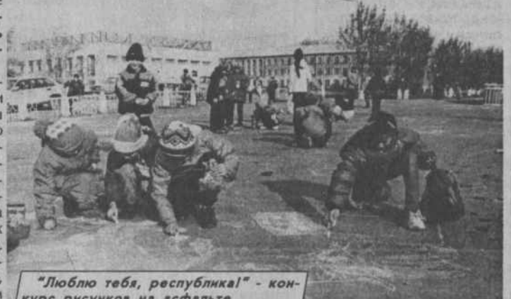
"Люблю тебя, республика!" - конкурс рисунков на асфальте.