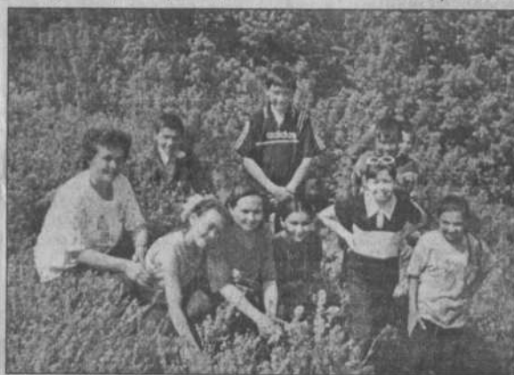
Родители принимают активное участие при организации летнего отдыха.