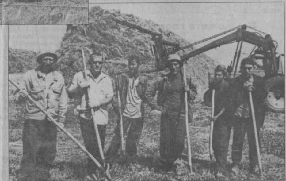
Укладчики на кормовом дворе.

хозяйства. Например, пенсионеры, нуждающиеся в сене для своего скота, добровольно собрали по тысяче рублей за тонну этого корма с учетом стоимости затрат, набра-