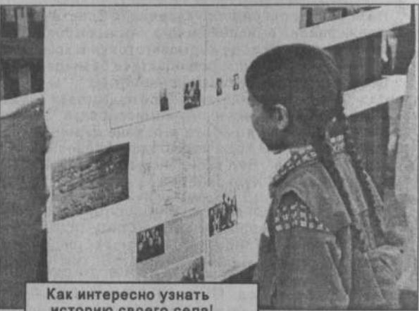
Как интересно узнать историю своего села!

Обидная поговорка, но, увы, справедливая. Вы скажете: "Ну что с того, если я буду знать, допустим, сотню моих предков? Что это изменит в моей жизни сегодня?" Да в том и дело, что эта череда пока еще вам неизвестных, ушедших в прошлое предков, начни вы только их поиск, во многом изменит ваш взгляд на настоящее и будущее. Сегодня так важно заглянуть поглубже в истоки своих корней, увидеть тех замечательных людей, которые создавали славу нашей земли.