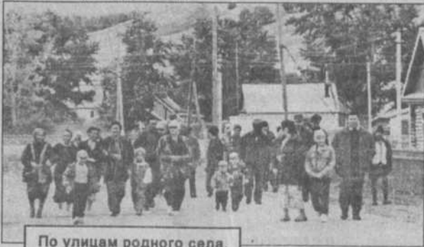
По улицам родного села.