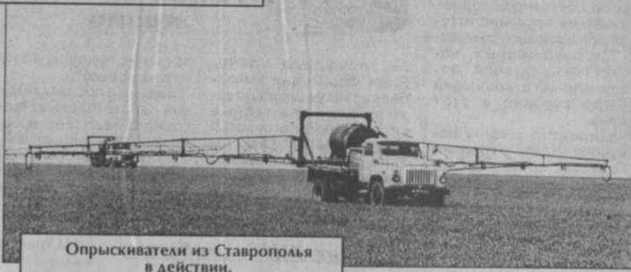
Опрыскиватели из Ставрополья в действии.

агрегатов напоминает что-то вроде душа, когда тугие струи большей частью просто впитываются в почву не принося большого вреда сорнякам, то здесь мелкокапельное, малообъемное распыление ведется с более высокого расстояния от земли и скорее напоминает опыление самолетом на бреющем полете. Значительно увеличивается время работы одной установки, ширина захвата каждой из них 20-21 метр. Очень важна работа таких установок и в экологическом плане - не страдают лесопосадки и лесные насаждения, что