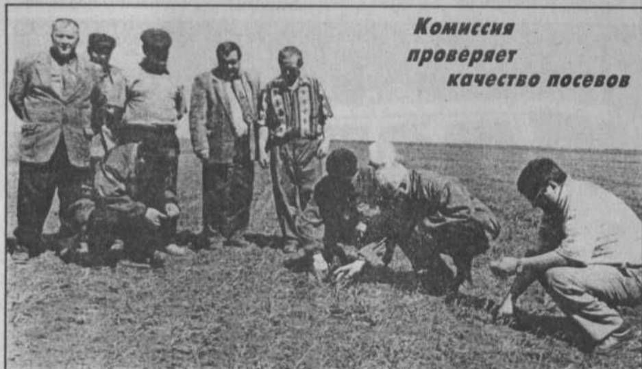
Комиссия проверяет качество посевов