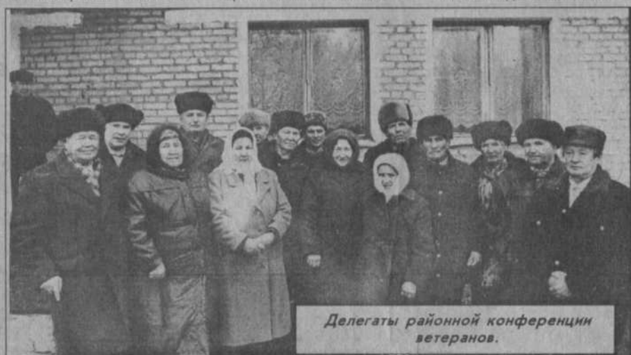
Делегаты районной конференции ветеранов.

руководством местной администрации и хозяйства, многогранна и разнообразна. Важен тесный контакт, положительное отношение к тем или иным вопросам руководителей. Многие сделали советом ветеранов в прошлом году совместно с местной администрацией. Проводились выездные за-