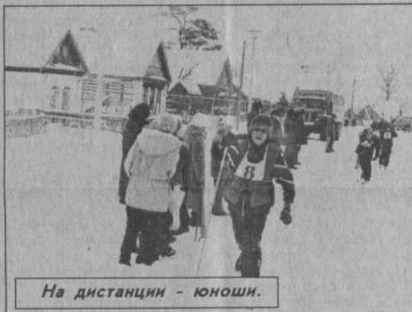
На дистанции - юноши.

на длинных дистанциях. Ныне в состязаниях женщин на пять километров участвовали 12 лыжниц из различных сел и деревень района. Отлично преодолела дистанцию