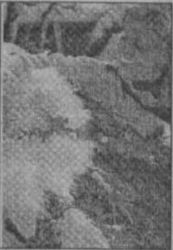
там, где она произрастает, не только в саду, но и в лесу).

Февральская ростепель ничего не стоит. В феврале зима с весной встречается впервой. Февральский снег весной пахнет. Февраль силен метелью, а март - капелью.