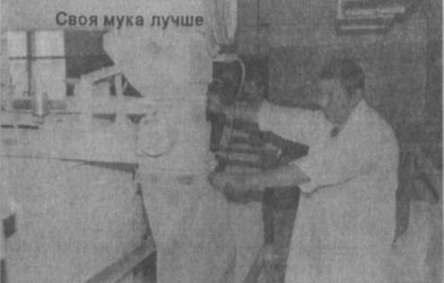
Своя мука лучше