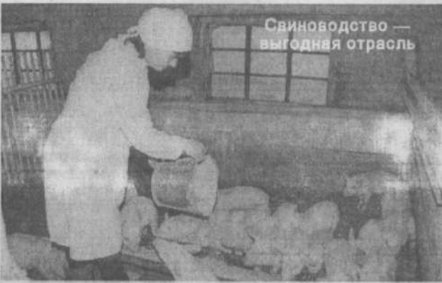
Свиноводство — выгодная отрасль

В селе Ново-Зирган открыт современный детский сад, рассчитанный на 90 мест. «Голубой» факел зажегся в населенных пунктах — Акъюлово и Урузбаево — завершающих точках газификации района. Вышла в свет книга ветерана педагогического труда района Р.Г.Насырова «Века и поколения», которая освещает богатую историю района на различных его переломных моментах развития.