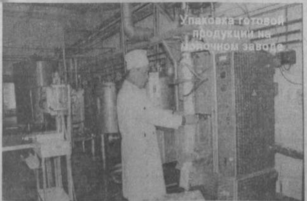
Упаковка готовой продукции на мукомольном заводе