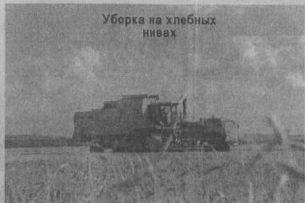
Уборка на хлебных нивах