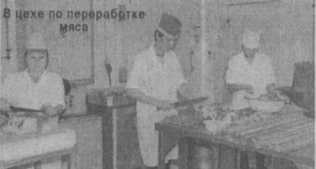
В цехе по переработке мяса