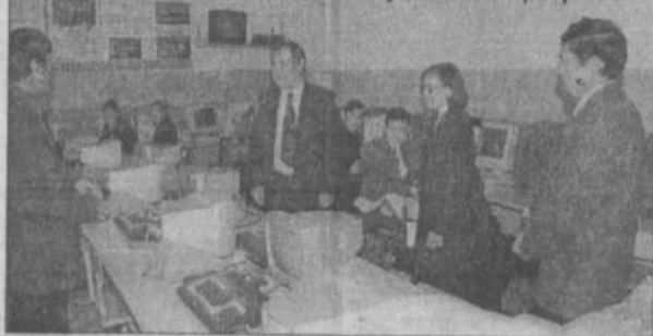
Компьютеризация учебного процесса