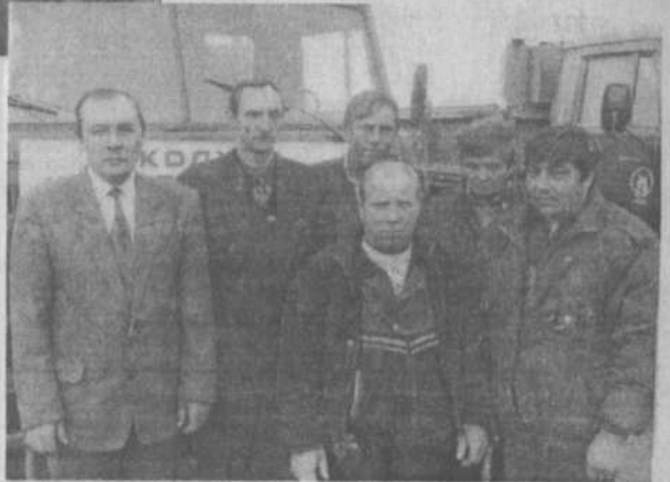
Дружный и сплоченный коллектив колхоза «Красный доброволец» среди награжденных Дипломом за успешное проведение уборки урожая. Хозяйством сдано государству 3190 тонн хлеба при плане 2200т.