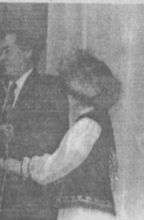
Поздравительные телеграммы от Президента РБ М.Г. Рахимова, Председателя Госсовета РБ К.Б.Толкачева, глав администраций районов Баймакского, Благоварского, министерств, многочисленных ведомств, организаций и учреждений.