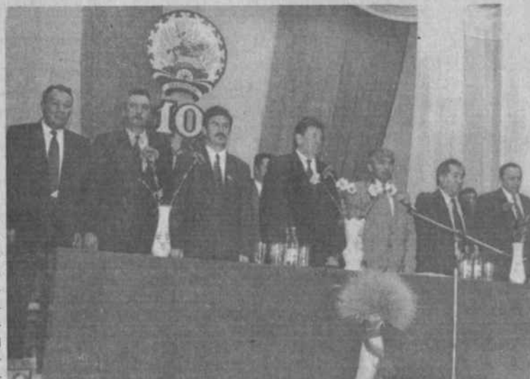
Президиум торжественного собрания – звучит гимн республики

1990 года Верховный Совет республики принял этот исторический документ, – отметил он, – открывший новую страницу в истории развития нашей республики. Для нас эта дата – главный государственный праздник республики