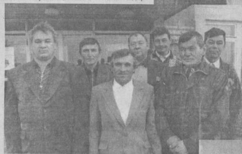
Руководители, специалисты, механизаторы и водители совхоза «Бузавлыкский» в числе первых выполнили заповедь хлебороба – в государственный фонд ими отправлено 6000 тонн зерна при плане 5900.