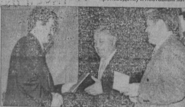
Вручение диплома и денежной премии коллективу АКХ "Маканский", занявшему третье место.