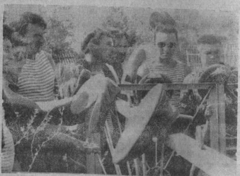
НА СНИМКАХ: некоторые моменты праздника десантников.