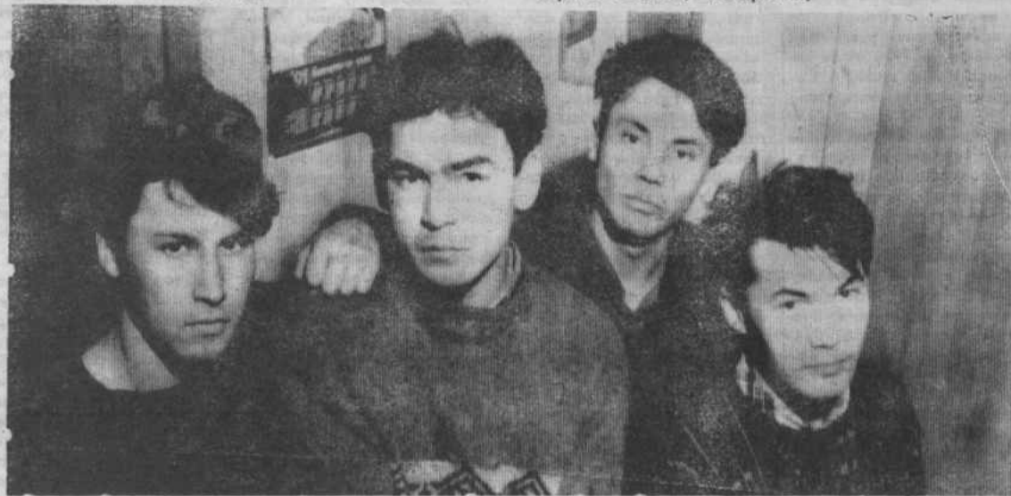
Творчество наших читателей

Голод колбасный, очень опасный Очередь стонет, но ждет Глас депутатский, пламенно страстный Снова с трибуны врет. Все отболело, перегорело В наших сердцах дотла Братские войны до беспредела Предкам в земле нет сна. Что же нам делать, что переделать Строй — перестроенный мир!! Чтоб шли вместе слово и дело Нужно вставать, час пробил.