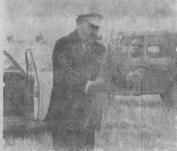
(Продолжение, начало в № 8)

СТАВ КОММУНИСТОМ еще в армии я себе выбрал нелегкую дорогу в жизни. Коммунисты имели право только честно и лучше трудиться на благо Отечества и больше никаких преимуществ. Напрасно многие теперь любят говорить, что члены партии имели какие-то привилегии.