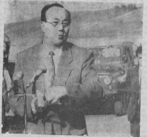
НА СНИМКЕ: Муртаза Губайдуллович РАХИМОВ на Хайбуллинской земле.

М. Г. Рахимов — первый Президент Республики Башкортостан