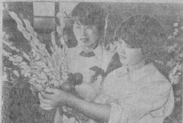
Создание в уездных городах и поселках мощной сети промышленных

и торговых предприятий, как показала опыт последнего десятилетия, резко