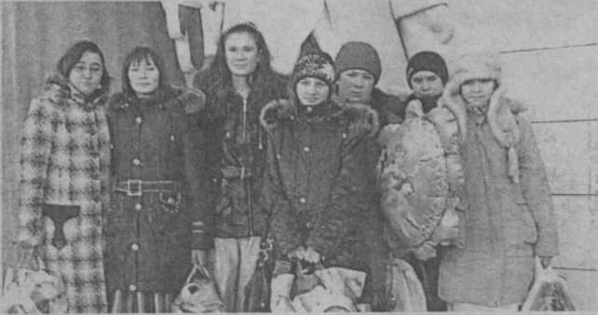
Снимок на память перед поездкой на республиканскую Президентскую елку.

Каждый из ребят, побывавший на елке, поставил для