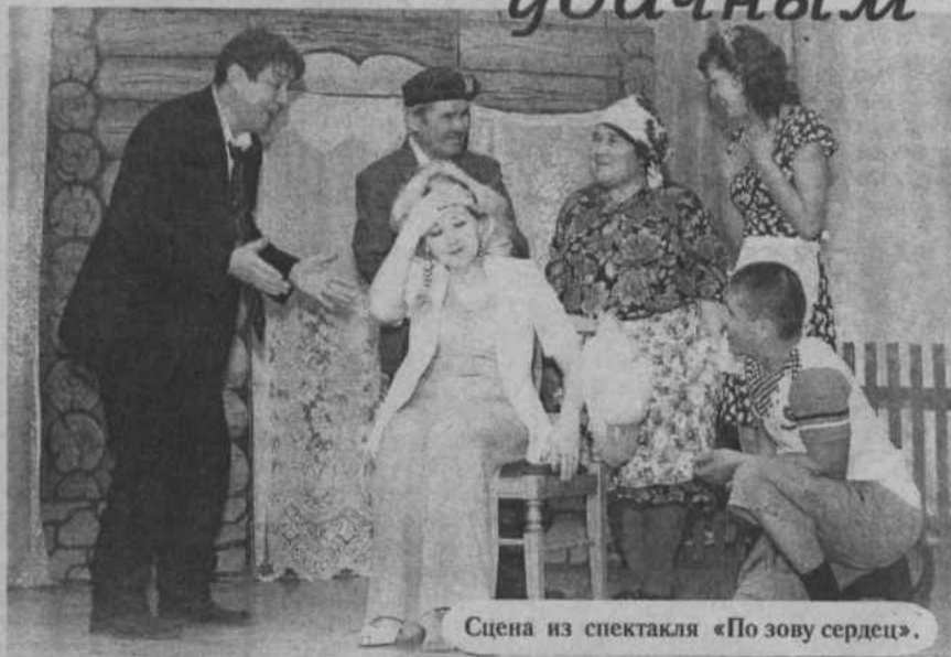
Сцена из спектакля «По зову сердец».

Минуло более четырех десятилетий с того момента, когда театральная труппа районного Дома культуры собрала первых своих зрителей на самое первое представление.