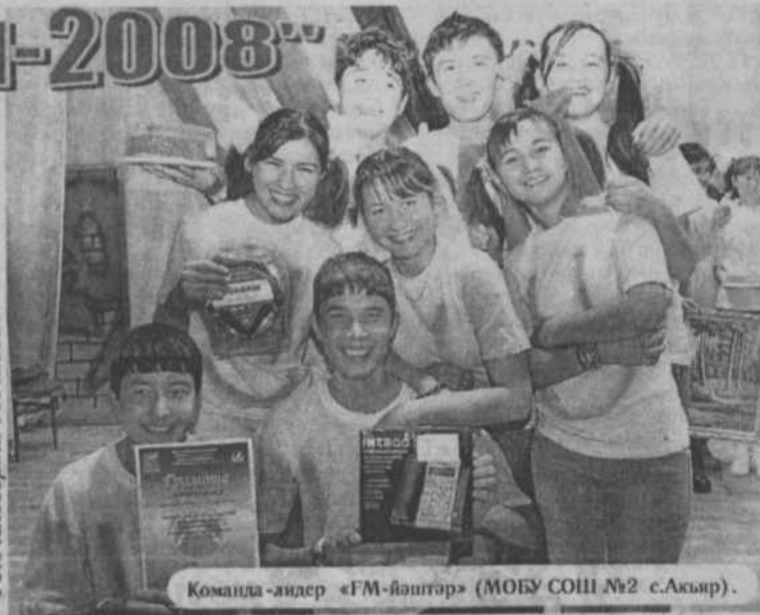
Команда-лидер «FM-йэштэр» (МОБУ СОШ №2 с.Актяр).