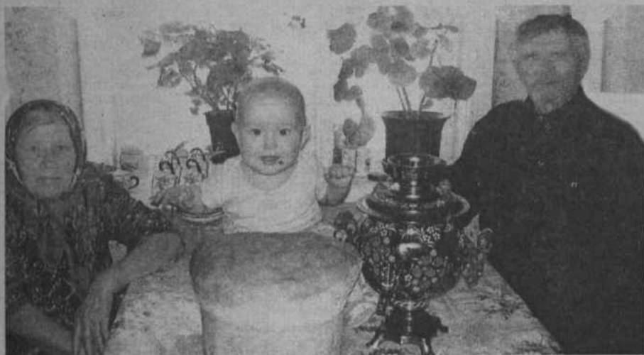
«Как прабабушка в деревне испекла нам каравай... А прадедушка с малиной заварил внучонку чай...»

Аппетитный аромат свежеспеченного каравайки будто из самого детства: упавшись курносом носом в теплую мягкость, а оттуда горьковатый привкус степных трав, кажется, в самую душу проникает. Целое таинство такой хлеб испечь. Бабушка для него сама и хмель выращивает, и дрожжи варит, и за ночь 3-4 раза подбивает тесто, перемишивает, пока оно перестанет пузыриться, как она говорит «разговаривать» и к рюкам лишнуть.