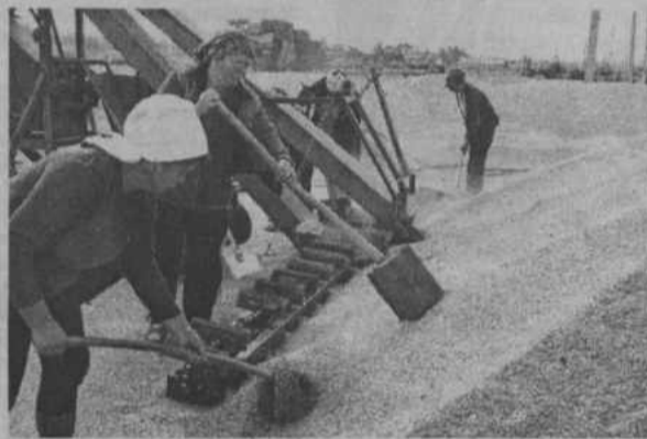
На току СПК «Хайбуллинский».

ХЛЕБОРОБЫ РАЙОНА! ПРИЛОЖИМ ВСЕ СИЛЫ, ЗНАНИЯ И ОПЫТ ДЛЯ УСПЕШНОГО ЗАВЕРШЕНИЯ УБОРОЧНОЙ СТРАДЫ.