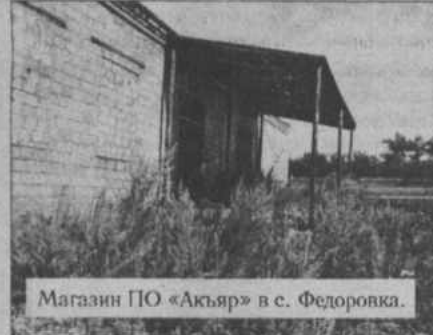
Магазин ПО «Акъяр» в с. Федоровка.