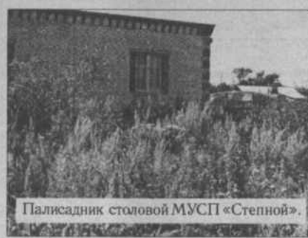
Палисадник столовой МУСП «Степной».