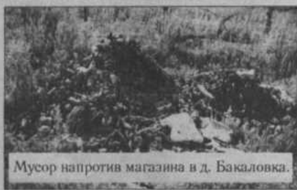
Мусор напротив магазина в д. Бакаловка.