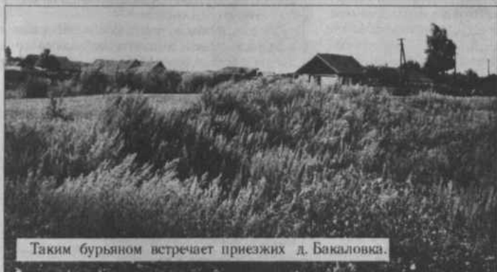
Таким бурьяном встречает приезжих д. Бакаловка.

Комиссия администрации муниципального района совместно с корреспондентами районных газет «Хайбуллинский вестник» и «Хайбулла хабарлары» в прошедшую пятницу, объявленную санитарным днем, выехала с рейдом в населенные пункты района с целью выяснения, как на местах организованы субботники, как обстоят дела с благоустройством, поддерживается ли в наших селах и деревнях надлежащий порядок. К сожалению, увиденная картина не обрадовала членов комиссии.