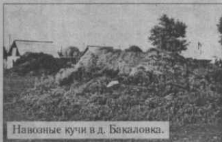
Навозные кучи в д. Бакаловка.