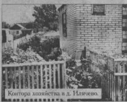
Контора хозяйства в д. Илячево.