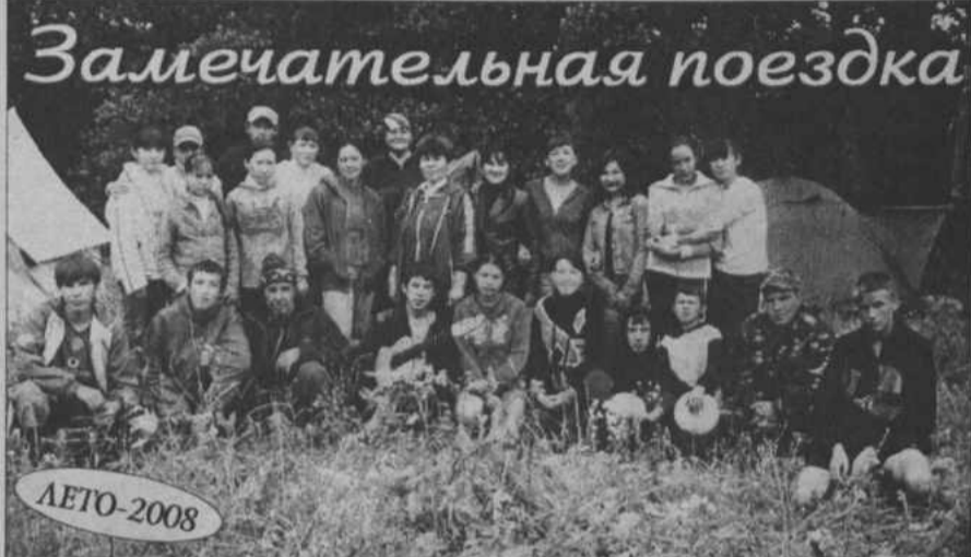
Замечательная поездка Летние каникулы — лучшая и незабываемая пора для укрепления здоровья, развития творчества и совершенствования возможностей ребенка, вовлечения детей в новые социальные связи, удовлетворение индивидуальных интересов и потребностей.

Десять туристов из первой и второй Акъярских школ, объединившись в один отряд под названием «Муравей», отправились в трехдневный поход. Маршрут дети выбрали сами. Наши юные туристы, объездив почти весь Хайбуллинский район, решили познакомиться с природой и историей деревни Абубакирово.