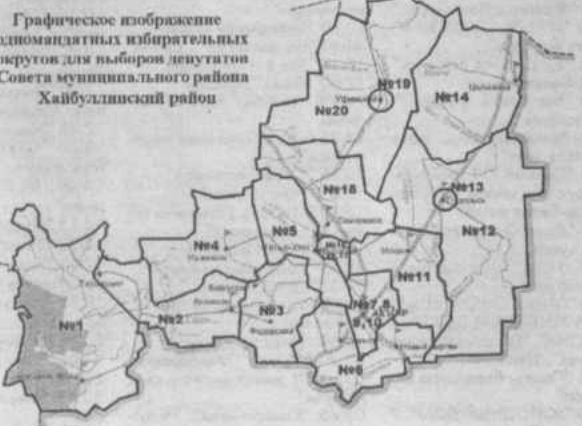
Графическое изображение одномандатных избирательных округов для выборов депутатов Совета муниципального района Хайбуллинский район

Приложение 2 к решению ТИК муниципального района Хайбуллинский район №29 от 16 июля 2008 г.