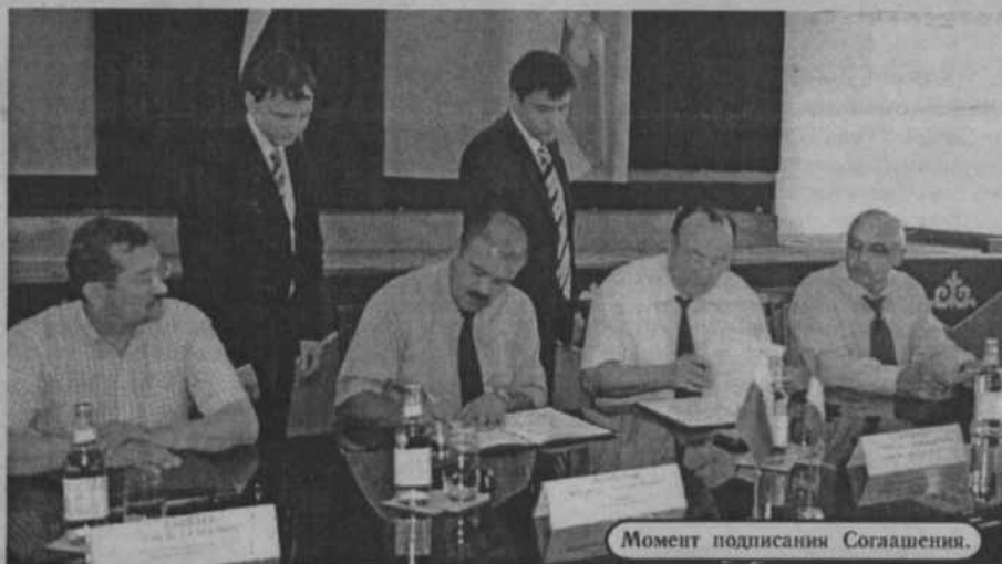
Момент подписания Соглашения.

бывал и на участке Юбилейного месторождения, где ведется извлечение золота из