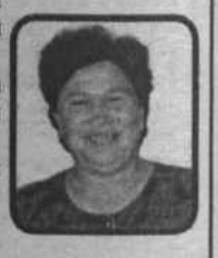
Близкие и родные.