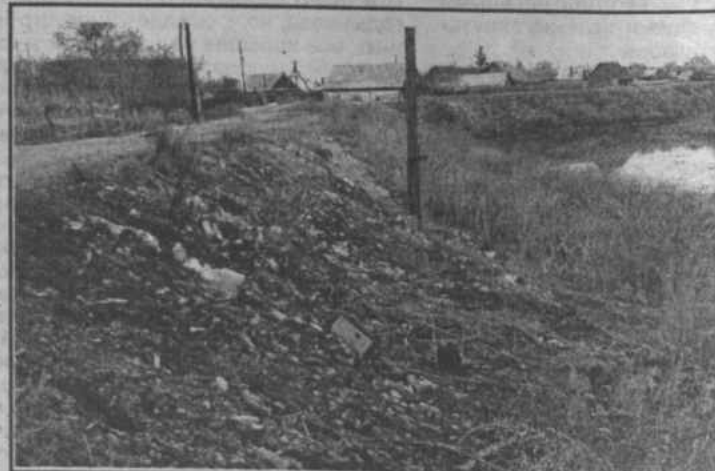
с. Акъяр, ул. М. Гареева. Окраины райцентра - место для свалки мусора?