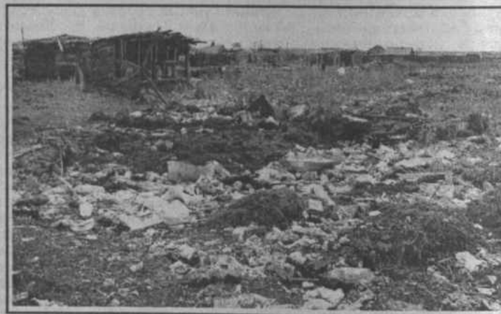
с. Садовый. Свалка мусора за хозяйственными постройками селян - привычный ландшафт окрестности.