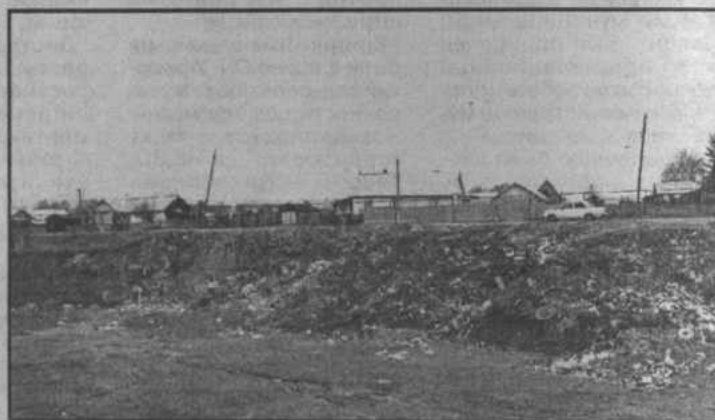
с. Бурибай. Мусор на склонах котлована при въезде в Бурибай.