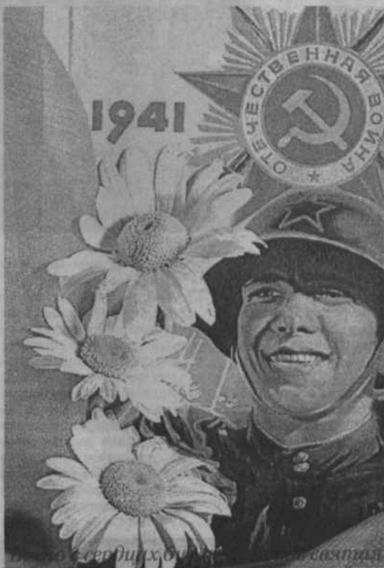
Подвиги славных, великих побед... Счастья, добра! С днем 9 Мая! Мирного неба и радостных лет!

ОБЩЕСТВЕННО-ПОЛИТИЧЕСКАЯ ГАЗЕТА ХАЙБУЛЛИНСКОГО РАЙОНА