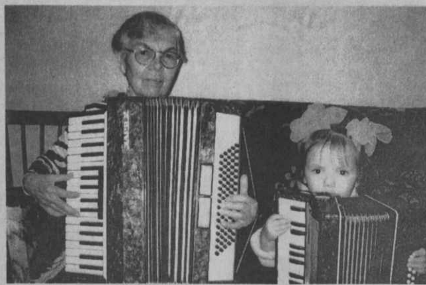
Мы играем и поем, с бабулечкой весело живем.