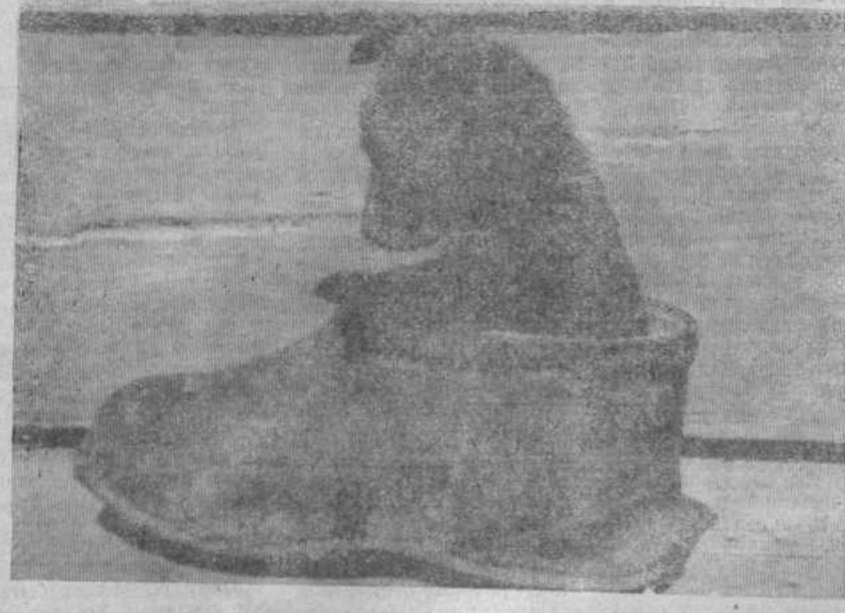
Редкий кадр. В дождливую погоду.