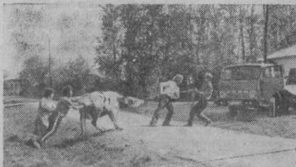
Может ли боров испытывать к человеку нежные чувства?

Этот номер газеты набирала Г. ЮЛАМАНОВА. Верстала Ф.ЗУЛКАРНАЕВА, Печатала Н. НУРАЕВА, Н. МУХАМЕДЬЯРОВА.