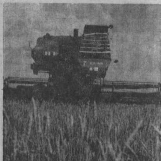
В сельских Советах